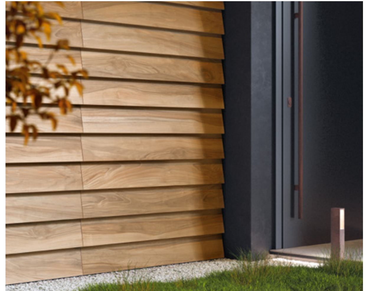
Tabula XL Noce Out Dry R11 20x120 / 7,9"x47,2"