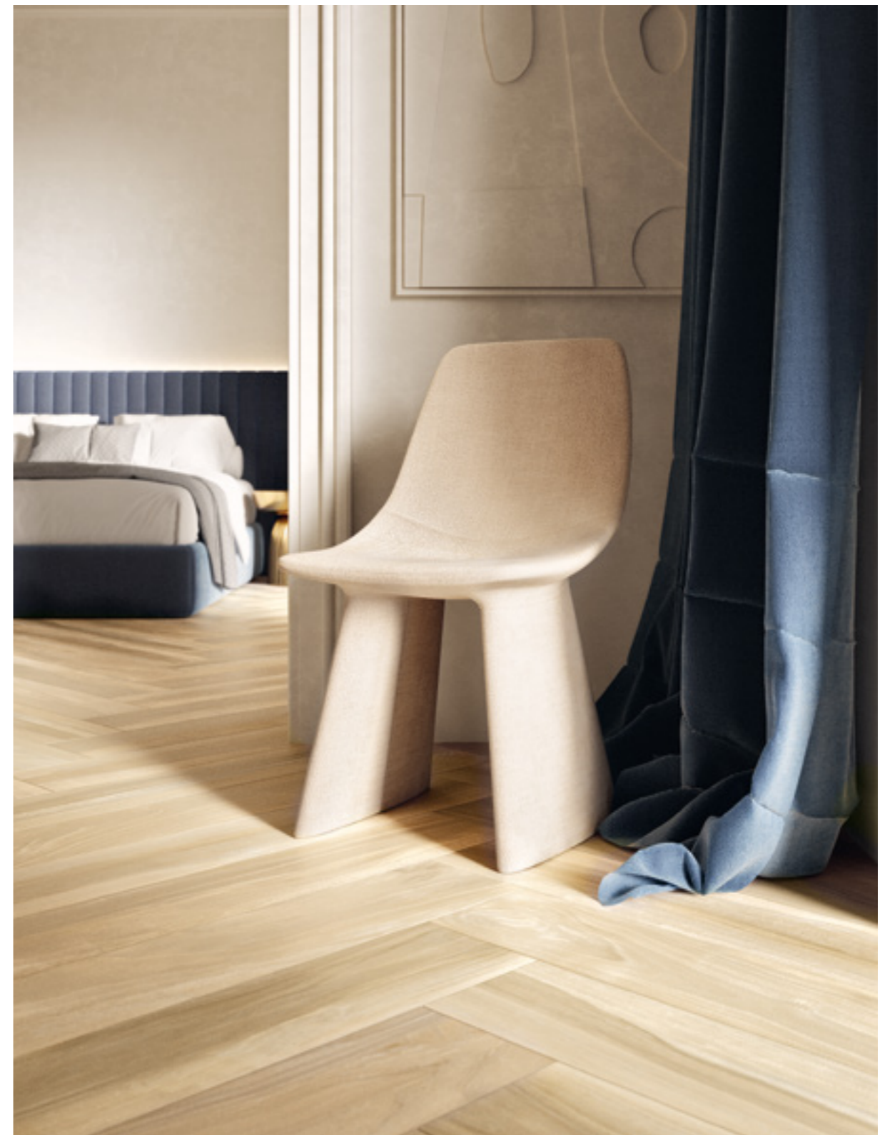
Tabula XL Miele 20x120 / 7,9"x47,2" >Tabula XL Cenere Naturale 20x120 / 7,9"x47,2"